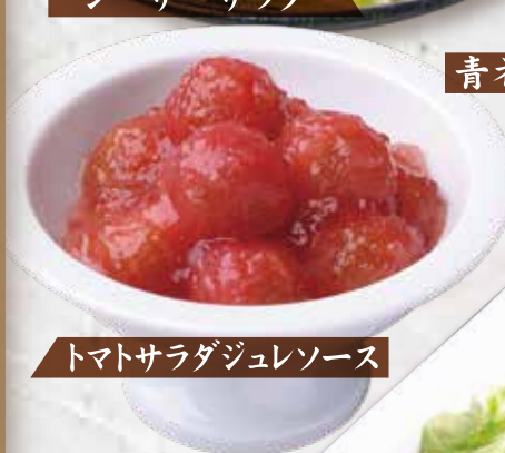
トマトサラダジュレソース