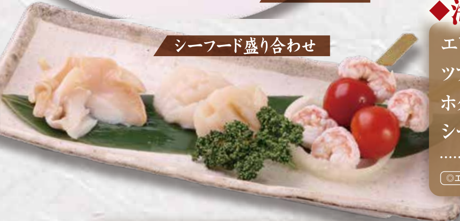
シーフード盛り合わせ