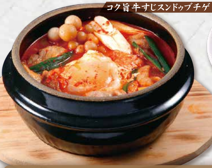
コク旨牛すじスンドゥブチゲ