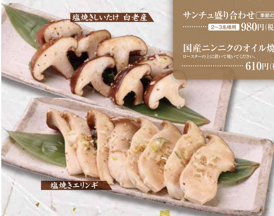
塩焼きしいたけ 白老産