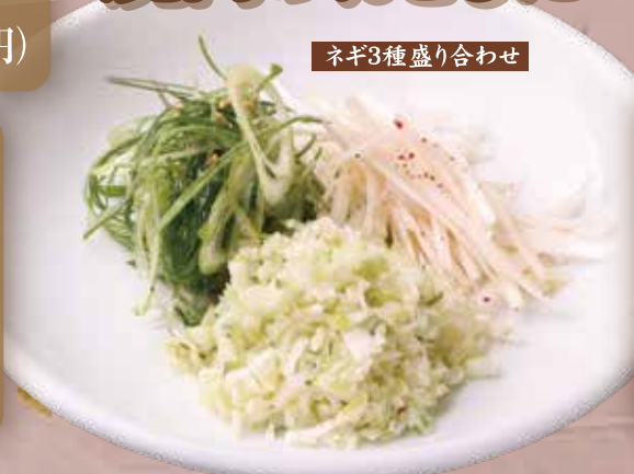
ネギ3種盛り合わせ

徳寿 おすすめ ホットネギタレ ロースターの上に置いて、温めてからお肉に乗せてお食ください。どんなお肉もネギ焼きに変身!! 370円(税込407円)