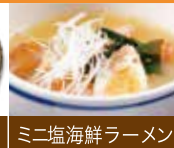
ミニ塩海鮮ラーメン