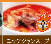
ユッケジャンスープ