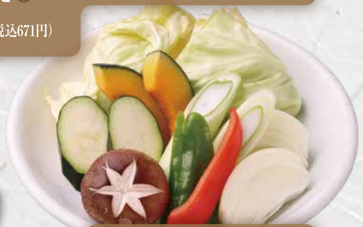
焼野菜盛り合わせ