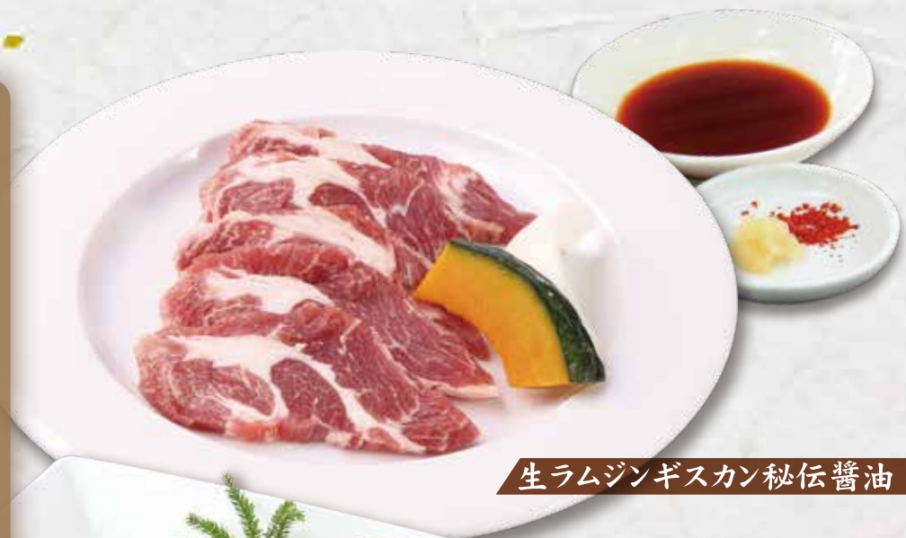
生ラムジンギスカン秘伝醤油