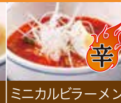
ミニカルビラーメン